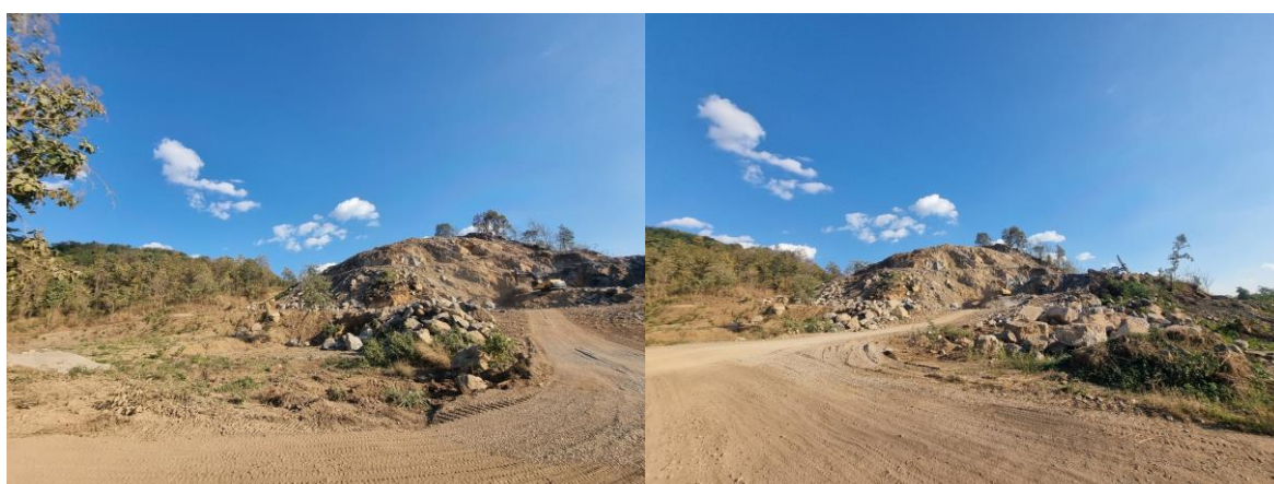
รูปที่ 1-1 สภาพพื้นที่หน้าเหมืองในปัจจุบัน

โครงการเหมืองแร่หินอุตสาหกรรมชนิดหินปูนเพื่ออุตสาหกรรมก่อสร้าง ประทานบัตรที่ 31172/16477 ห้างหุ้นส่วนจำกัด จรลรัตน์ ร่วมแผนผังโครงการทำเหมืองเดียวกันกับ ประทานบัตรที่ 31171/16476 นางดารารัตน์ สรรค์พฤกษ์สิน (เดิมเป็นของนายจรล เยาวรัตน์ ก่อนมีการโอนประทานบัตรเป็นของ นางดารารัตน์ สรรค์พฤกษ์สิน) ประทานบัตรที่ 31173/16478 บริษัท พะเยาธุรกิจ จำกัด ประทานบัตรที่ 31174/16475 บริษัท พะเยาศิลาภัณฑ์ จำกัด และ ประทานบัตรที่ 31125/16017 บริษัท พิสิษฐ์ธุรกิจ จำกัด ตั้งอยู่ที่ หมู่ที่ 6 ตำบลแม่กา และหมู่ที่ 2 ตำบลจำปาหวาย อำเภอเมืองพะเยา จังหวัดพะเยา มีอายุประทานบัตร 26 ปี นับแต่วันที่ 26 เดือน พฤษภาคม 2565 ถึงวันที่ 25 เดือน พฤษภาคม 2591 ได้รับความเห็นชอบกับรายงานการวิเคราะห์ผลกระทบสิ่งแวดล้อมโดยผ่านการพิจารณาของคณะกรรมการผู้ชำนาญการพิจารณารายงานการวิเคราะห์ผลกระทบสิ่งแวดล้อมด้านเหมืองแร่ ในการประชุมครั้งที่ 35/2562 เมื่อวันที่ 3 ธันวาคม 2562 สำนักงานนโยบายและแผนทรัพยากรธรรมชาติและสิ่งแวดล้อม แจ้งผลการพิจารณารายงานการวิเคราะห์ผลกระทบสิ่งแวดล้อม คณะกรรมการผู้ชำนาญการมีมติเห็นชอบ โดยกำหนดให้โครงการจะต้องปฏิบัติตามมาตรการป้องกันและแก้ไขผลกระทบสิ่งแวดล้อมและมาตรการติดตามตรวจสอบผลกระทบสิ่งแวดล้อมตามหนังสือที่ ทส 1010.2/17061 ลงวันที่ 9 ธันวาคม 2562 ปัจจุบันทำการเปิดเหมืองโดยวิธีเหมืองเปิดตามที่แผนผังโครงการกำหนด